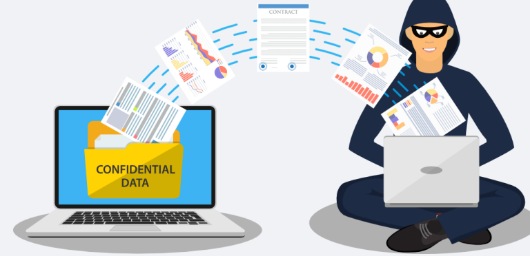
Data Theft डाटा चोरी