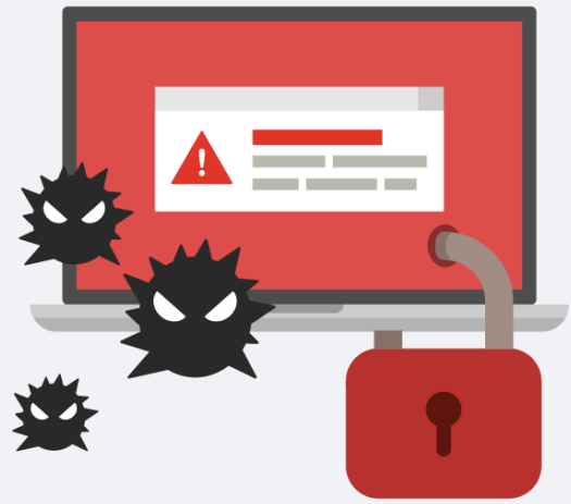
Malware Attacks मालवेयर आक्रमण