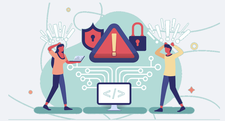
Third Party risk तेस्रो पक्ष जोखिम